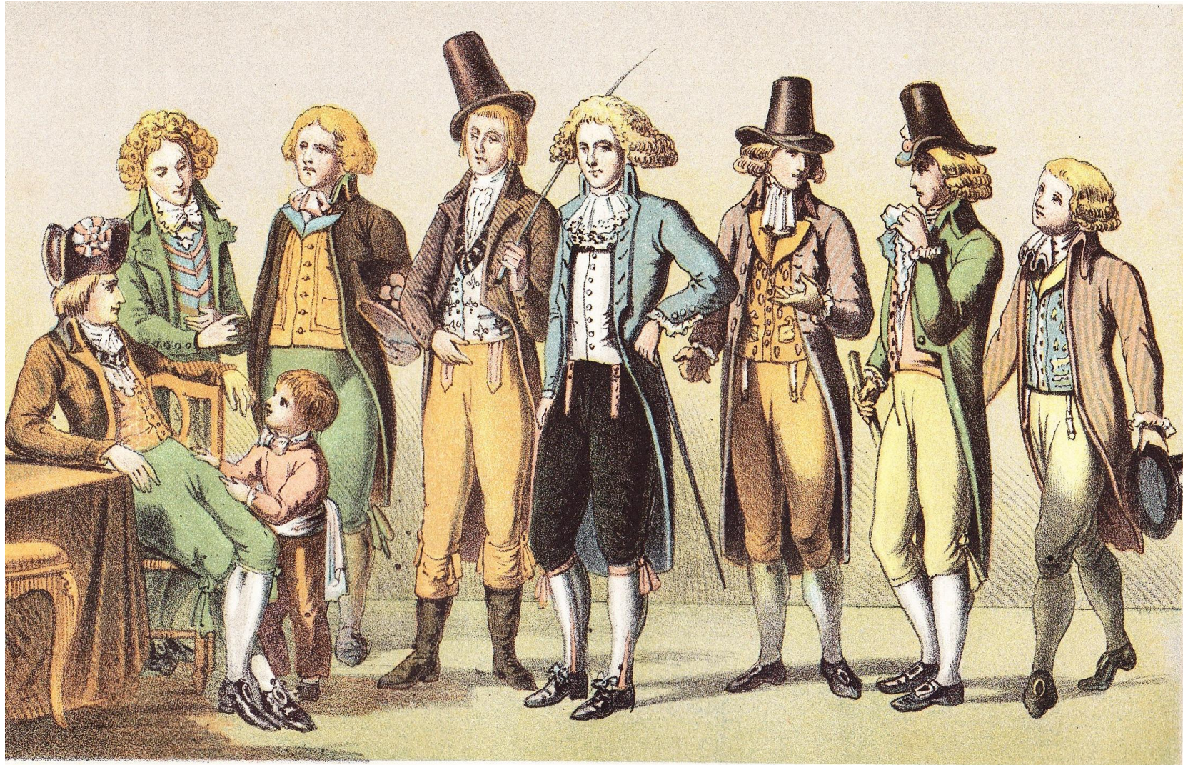
HEEREN GEWAAD. 18 e eeuw 2 e helft.